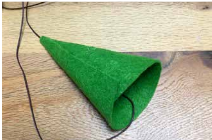
Filz zur Mütze zusammenrollen / festkleben