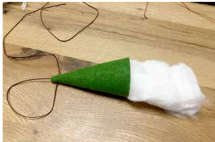
Bart durch Mütze ziehen