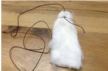
Schnur an Watte befestigen