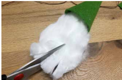
Bart schneiden und zurecht zupfen