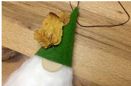
Nase aufkleben und Mütze dekorieren