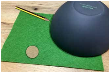
1/4 Kreis groß (Mütze) / Kreis klein (Nase)